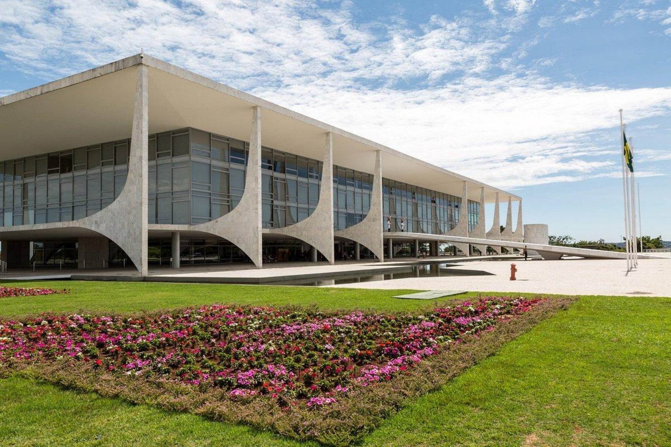
Palacio do Planalto