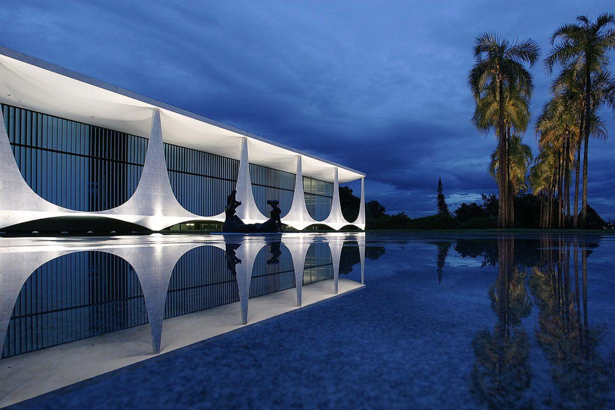
Palacio de Alvorada