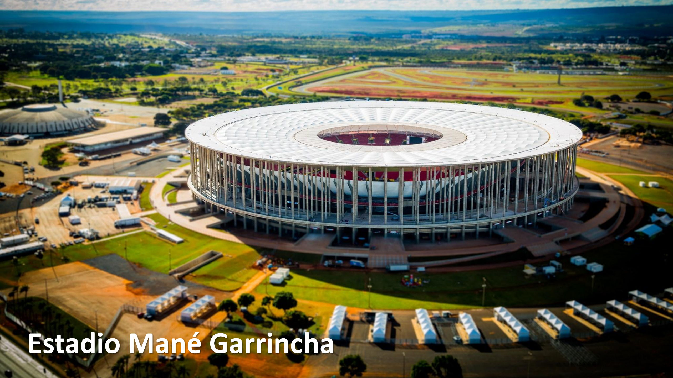
Estadio Mané Garrincha